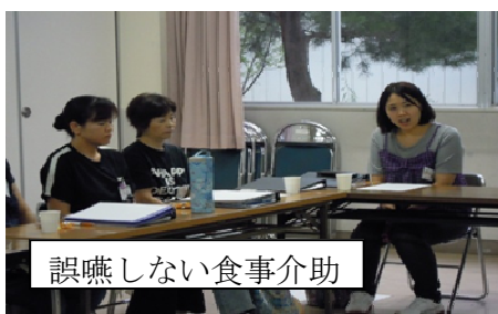
誤嚥しない食事介助